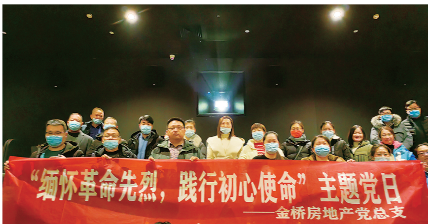
为进一步厚植爱国主义情怀,巩固拓展党史学习教育成果,增强政治责任感和历史使命感,近日,房地产公司党总支组织开展“缅怀革命先烈、践行初心使命”主题党日观影活动,部分党员代表观看了爱国主义影片《长津湖之水门桥》。(顾卫远)

抓应急演练,提高事故应急处置能力促党建工作。组织万家欣市场消防、巨龙街市场疫情防控、双菱公司黄磷自燃处置、消防器材操作等演练,进一步提升员工安全综合素质。(金航宣)