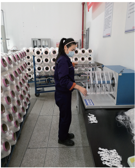
春节期间,神特新材料公司二期生产线高效运转,各岗位员工全力以赴赶制订单,经过一道道工序的生产检验,一箱箱超高分子量聚乙烯纤维产品被打包装车如期发往各地客户,以奋斗的姿态度喜迎农历虎年的到来。(神特宣)

不休息,保清洁。有一群人在春节期间放弃休息,一把扫帚、一辆环卫车……他们起早贪黑,无怨无悔,为辖区环境保洁辛苦地工作着,他们就是我们盐场的“马路天使”——环卫工人。“大年初一,大街小巷最多的就是爆竹的碎屑。过年大家都休息了,但我们不能休息啊,得把咱盐场打扫干净,让大家过个舒坦的新年!”一位环卫工人说道。(青宣)