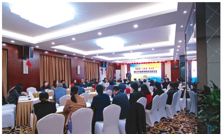
日前,以“新思维、心突破、赢未来”为主题的2017奥神氨纶高层论坛在乌镇黄金水岸大酒店隆重召开。20余家核心经销商和3家主要原料供应商共计50名特邀嘉宾应邀参加会议,共商未来发展大计。(毛滕)

灌西、奥神新材料、华茂等单位在会上作了交流发言,会议还对2016年度工会同业务竞赛优胜单位、工会创新项目、女职工工作先进集体进行了表彰。(工投工会 工宣)