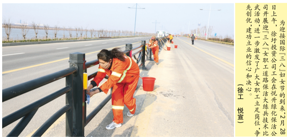
为迎接国际“三八”妇女节的到来,2月28日上午,徐圩投资公司工会在悦升绿化保洁公司开展“三八”女职工道路保洁大练兵比武活动,进一步激发了广大女职工立足岗位,争先创优,建功立业的信心和决心。(徐工 悦宣)