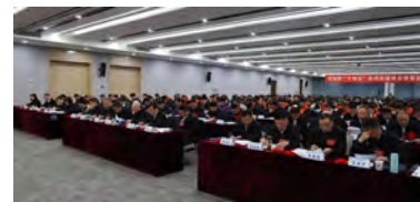
职工代表听取并审议《工作报告》