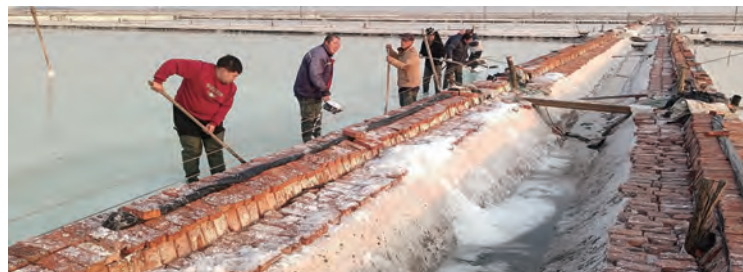
连日来，日晒制盐新河分公司立足原盐生产实际，对越冬卤水进行集中冷冻除硝作业，通过采挖、疏通等全力清理盐池内芒硝，截至目前，已除硝3800余公亩，为后续储备更多低硝卤水奠定坚实基础。（范继龙）

聚焦民生引领，彰显“新质感”。 畅通诉求反馈渠道，健全完善民主管理。规范职代会召开程序，优化职工代表构成比例，增强代表的广泛性。广泛征集提案，听取合理化建议，让职工充分行使参与权、建议权、表决权。迭代深化创新创效，内生动力竞相迸发。以培育工匠为目标，持续推进“一中心三基地”建设，适应产业工人队伍多元化需求。同时，立足为职工办实事、办好事、解难事，坚持开展“春有慰问、夏送清凉、金秋助学、冬送温暖”的爱心帮扶活动，建立健全“集体协商”制度，提升劳动关系和谐企业建设水平。（许东彦）