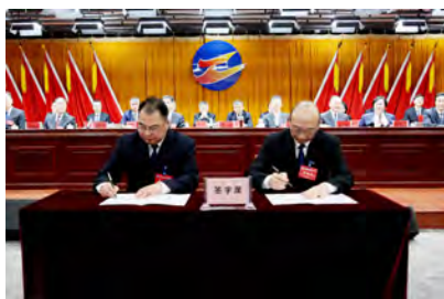
签订《2025年度集体合同》