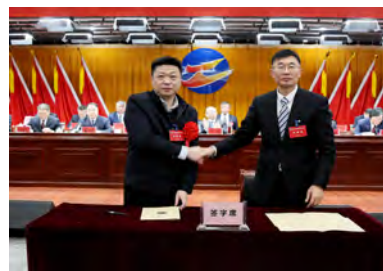
签订《2025年度经营业绩考核责任书》