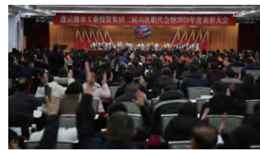
职工代表审议通过相关报告、方案及意见